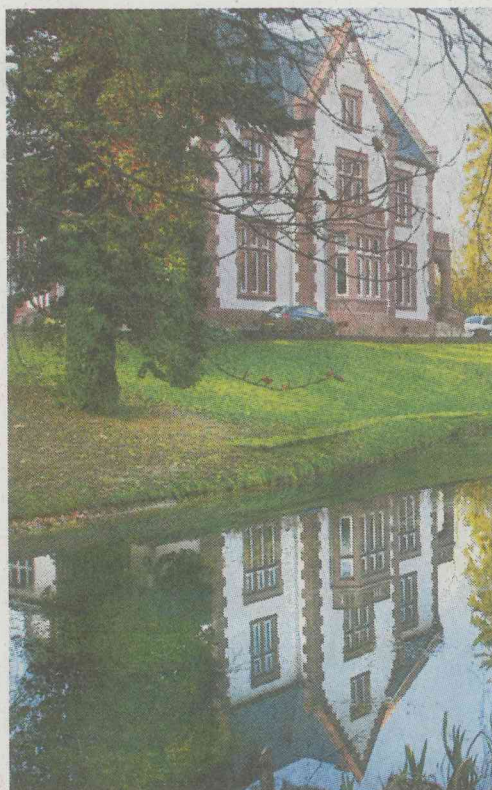
Henri Tudor ist in seinem Geburtsort ein Museum gewidmet.

1970 hat die Sauergemeinde das „Schloss“, wie es im Volksmund heißt, gekauft. „Ohne die vielen Sponsoren und die Un-