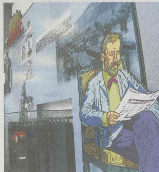
Henri Tudor liest Zeitung, und Museumsbesucher erfahren Details zu seinen Erfindungen.

◆ Öffnungszeiten: mittwochs bis sonntags 14 bis 18