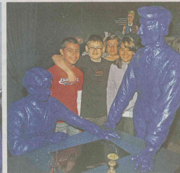
Im „blauen Zimmer“, einer Wohnstube, erleben Schüler Erhellendes zum Thema Elektrizität.

Uhr, Juli und August montags bis sonntags 14 bis 18 Uhr. Auf Anmeldung können Gruppen